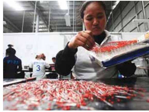
မင်နီဘာအာ ကုမ္ပဏီက အဆိုပြုလွှာတစ်စောင်ကို နိုဝင်ဘာလအတွင်းက တင်ပြခဲ့ခြင်းဖြစ်ပြီး ကမ္ဘောဒီးယားနိုင်ငံ ဖွံ့ဖြိုးမှုကောင်စီ

ယင်းကဲ့သို့ ရင်းနှီးမြှုပ်နှံမှုတိုးချဲ့သည့်ကိစ္စနှင့် ပတ်သက်၍