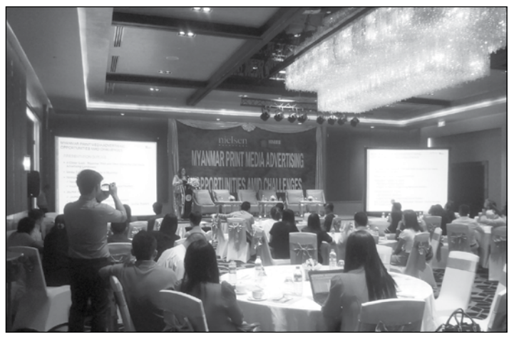
စားကြတယ်။ ပုံနှိပ်မီဒီယာအတွက်ဆို အဲဒါရဲ့ အကျိုးဆက်က စာဖတ်နန်း ကျလာတဲ့အတွက် စာအုပ်စာပေ ထုတ်ဝေမှုနန်း နည်းလာနိုင်သလို ကြော်ငြာထည့်မှုနန်းလည်း နည်းသွားနိုင်ပါတယ်။ ဒါကြောင့် ကြော်ငြာရှင်က ပုံနှိပ်မီဒီယာဆီက ဘာလိုချင်တာလဲ၊ ကြော်ငြာရှင်ကို ကူညီပေးနေတဲ့ ကြော်ငြာအေဂျင်စီက ရော ဘယ်အချက်အလက်တွေကို ကြည့်နေတာလဲ၊ ထုတ်ဝေသူတွေက ရော ဘာပေးချင်တာလဲ။ အဲဒီ သုံးဦး သုံးဖလှယ် ညီညီညွတ်ညွတ်ရှိမှ ဒီပုံနှိပ်မီဒီယာ နယ်ပယ်တိုးတက်မှာပါ” ဟု

Nielsen MMRD မှ စီစဉ်သော Myanmar Print Media Advertising Opportunities Amid Challenges ဆွေးနွေးပွဲကို ဒီဇင်ဘာ ၆ ရက်က ရန်ကုန်မြို့၊ နီနိုတယ်ဟိုတယ်၌ ကျင်းပပြုလုပ်ခဲ့သည်။ “ကျွန်တို့ကုမ္ပဏီကနေ စစ်တမ်းကောက်ယူထားတဲ့ အချက်အလက်တွေကတစ်ဆင့် မြန်မာ့ပုံနှိပ်မီဒီယာလောကမှာ ဘာတွေဖြစ်နေသလဲ၊ ဘာတွေဖြစ်တော့မလဲဆိုတာ ပြောပြချင်တာ။ အထူးသဖြင့် ကြော်ငြာရှင်တွေက မီဒီယာအစီအစဉ်လုပ်တော့မယ်ဆိုရင် ဘယ်မီဒီယာကိုထည့်ရမလဲဆိုတာကို အရင် စဉ်းစားကြတယ်။ ပုံနှိပ်မီဒီယာအတွက်ဆို အဲဒါရဲ့ အကျိုးဆက်က စာဖတ်နန်း ကျလာတဲ့အတွက် စာအုပ်စာပေ ထုတ်ဝေမှုနန်း နည်းလာနိုင်သလို ကြော်ငြာထည့်မှုနန်းလည်း နည်းသွားနိုင်ပါတယ်။ ဒါကြောင့် ကြော်ငြာရှင်က ပုံနှိပ်မီဒီယာဆီက ဘာလိုချင်တာလဲ၊ ကြော်ငြာရှင်ကို ကူညီပေးနေတဲ့ ကြော်ငြာအေဂျင်စီက ရော ဘယ်အချက်အလက်တွေကို ကြည့်နေတာလဲ၊ ထုတ်ဝေသူတွေက ရော ဘာပေးချင်တာလဲ။ အဲဒီ သုံးဦး သုံးဖလှယ် ညီညီညွတ်ညွတ်ရှိမှ ဒီပုံနှိပ်မီဒီယာ နယ်ပယ်တိုးတက်မှာပါ” ဟု